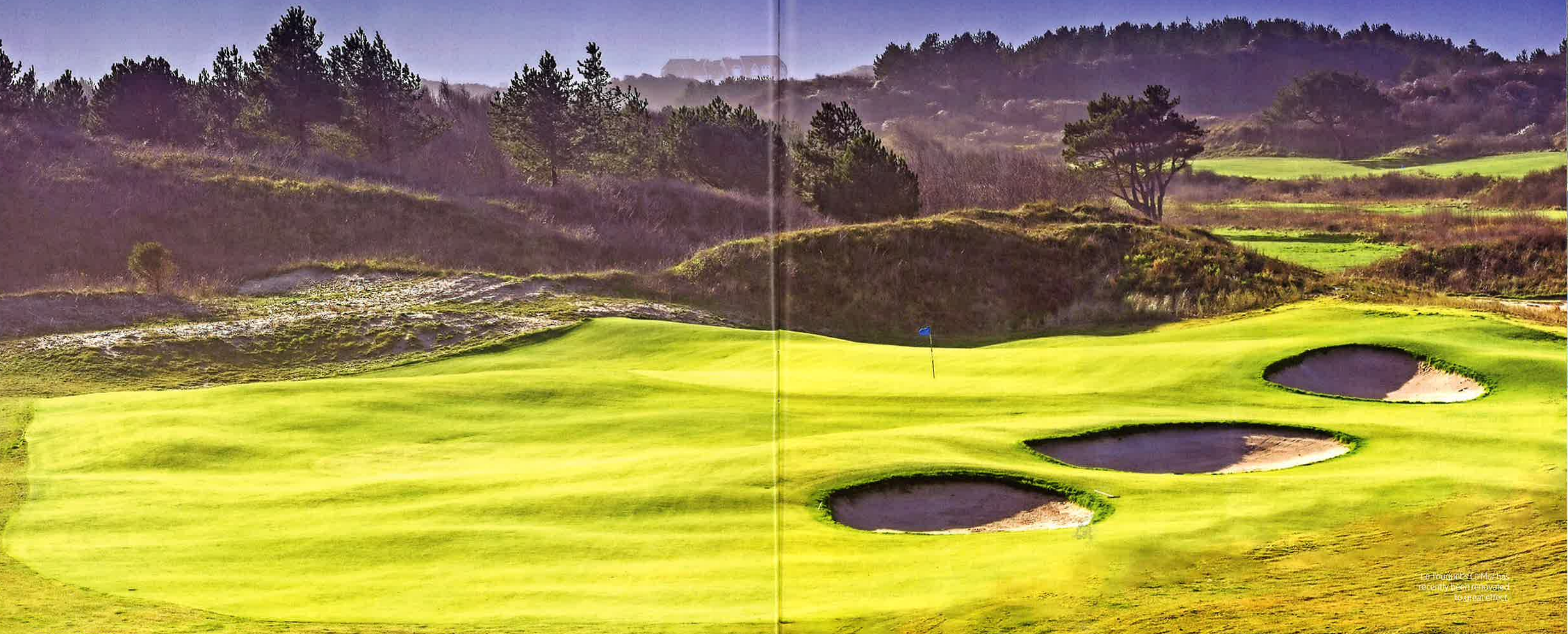
The Tour du Lac Mer has recently been renovated to great effect.

Le Golf National will be in everyone's minds for the next two years as it prepares to ▶