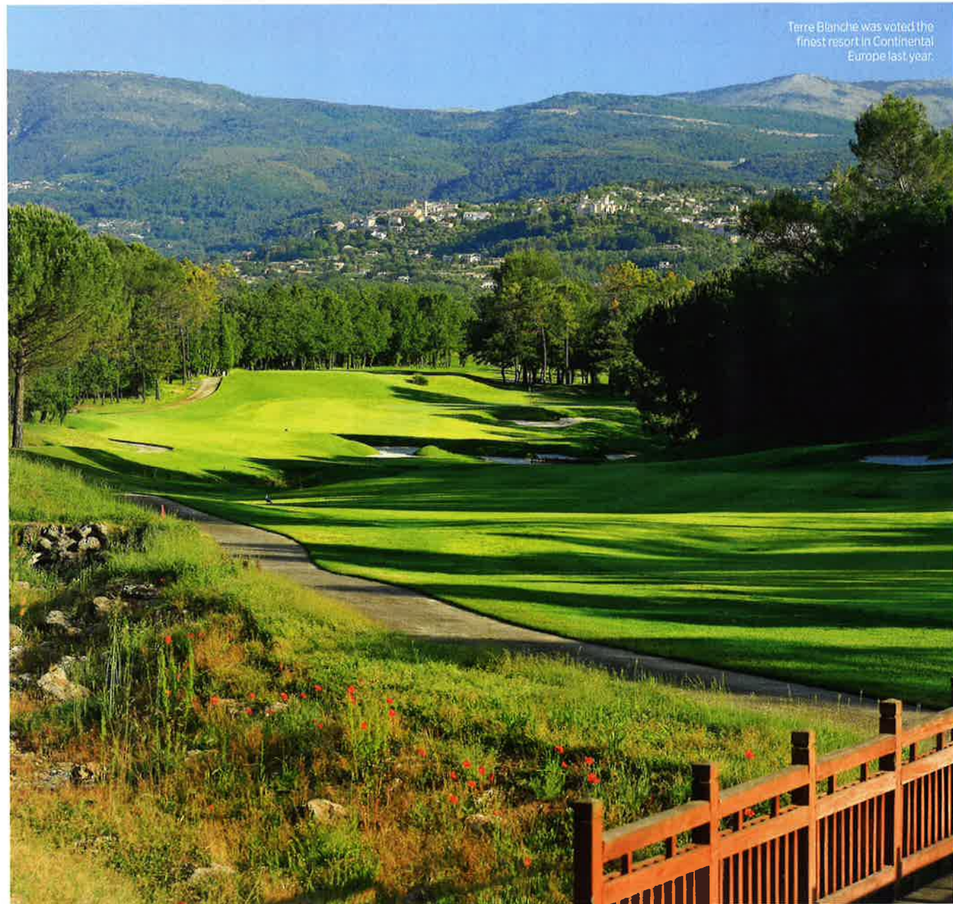
Terre Blanche was voted the finest resort in Continental Europe last year.

which begins in the lovely picture-postcard seaside town of Hardelot, but where the golf is of a heathland-woodland nature.