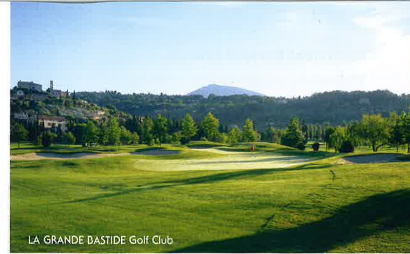
LA GRANDE BASTIDE Golf Club

★★★★ Château de la Bégude HOTEL - GOLF COTE D'AZUR