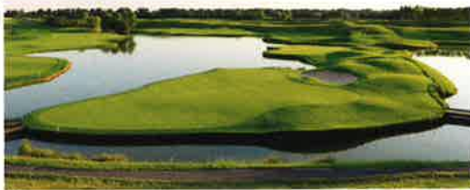
Golf du Médoc